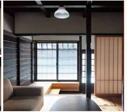
出格子と障子に挟まれた土間が 屋内外の繋がりを調整する