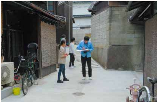
改修計画前には現地調査を行いました。

五条坂なかにわ路地は、令和元年8月に開催されたファンド委員会にて改修助成事業に選定されました。現状の建物調査や、検討会における専門家や関係者との協議を重ねながら、令和元年10月より工事が始まり、令和2年10月に竣工しました。