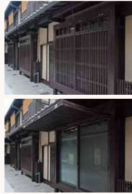
開け放つと庇にもなる出格子

路地の風情を醸し出す出格子ですが、低い採光性や画一的な外観に抵抗を感じるというご意見がありました。そこで、基本的な外観は保ちつつ、可動式の出格子として、現代の生活にも応える機能と、個々の住人の方の住まい方が外に表われる外観を備えたデザインを、設計者と大工さんにチャレンジしていただきました。屋内には土間と障子を合わせて配置し、屋外と屋内のつながりを調整できる空間を設けています。建築当初の意匠を最も残す1軒を参考に、全体の修景を施しています。